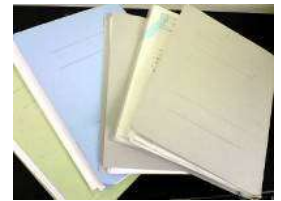
生徒ひとりひとりに個別電子フォルダ があります。生徒のその日の予定や 個別計画などが書いてあります(写真 は紙版)。