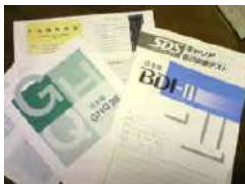
健康アンケートは、客観的に 自己理解！おもしろいですよ。