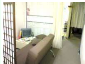
調子がよくない時は、ソ ファで休憩。ソファで休 憩できます。