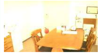
この部屋で先生と1対1で勉強したり カウンセリングしたり。