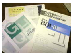
健康アンケートは、客観的に 自己理解！おもしろいですよ。