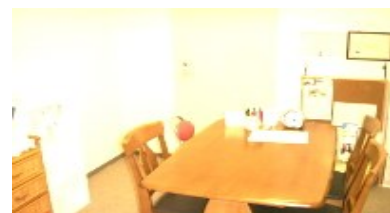
この部屋で先生と1対1で勉強したり カウンセリングしたり。