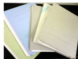
生徒ひとりひとりに個別電子フォルダ があります。生徒のその日の予定や 個別計画などが書いてあります(写真は紙版)。