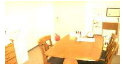
この部屋で先生と1対1で勉強したり カウンセリングしたり