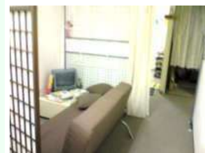
調子がよくない時は、ソ ファで休憩。ソファで休 憩できます。